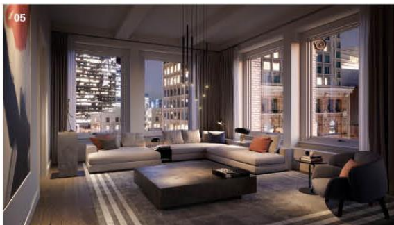
01 项目由一幢全新的45层高大厦和一幢10层楼高的历史建筑Aronson Building组成。02 能欣赏醉人风光的主卧。03 高挑而开扬的空间配合落地窗，让住客可眺望旧金山以至湾区的美景。04 大厦五楼是公共设施层，包含健身中心、带酒吧和壁炉的休闲厅、私人餐厅活动室、户外景观露台，以及业主俱乐部。05 历史建筑Aronson Building经翻新改造后，虽然不像新大厦般设有落地窗，但其窗户面积也相当大，令室内的采光极为良好。