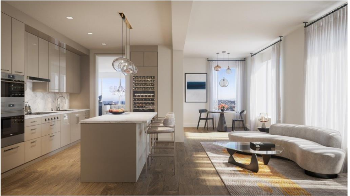
採光良好與寬敞的室內空間，成就現代奢華風情。

此外，物件主要設計特色包括：一個恢宏的玄關處、至少有兩面落地窗的豪華轉角起居室、精美奢華的用餐區、相鄰但私密的家庭活動區、作為每套住宅主心骨的寬大廚房、能欣賞醉人風光的主臥、沐浴在光線中的寬敞浴室、家庭辦公室及配浴室的客臥。大多數住宅的面積在2,800至4,000多平方英尺(約79至112坪)，房型為雙臥至四臥不等。