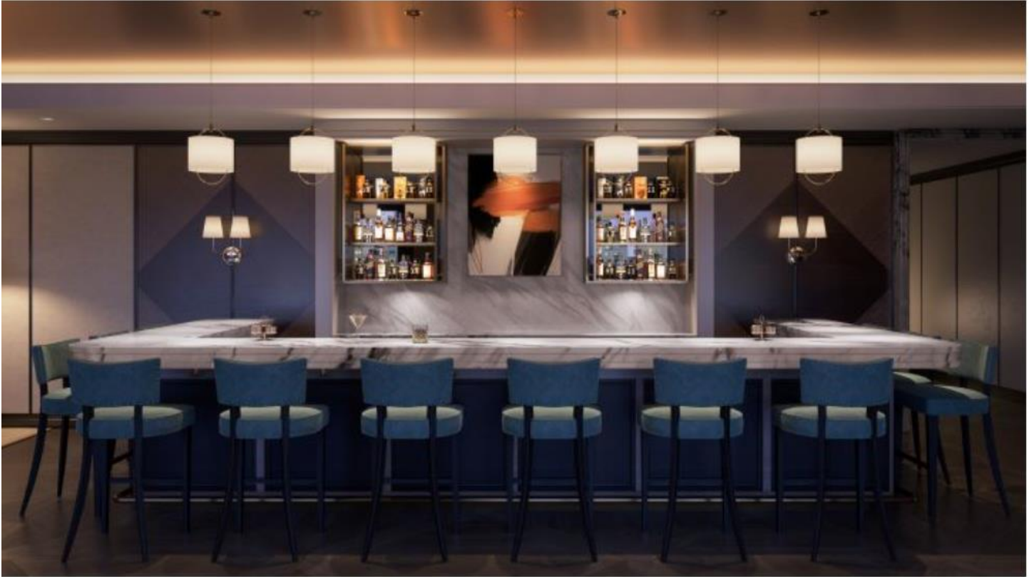
住戶專屬的獨享酒吧，在此與好友享受休閒時光。

這兩棟新舊建築於5樓的空共區域相連，於此特別由聞名全球的四季酒店團隊，專門為住戶們規劃了健身中心、專屬酒吧、私人宴會餐廳、品酒室和可眺望舊金山城貌夜景的戶外露台，為每位品味脫俗的屋主鋪陳絕佳的社交生活場域。