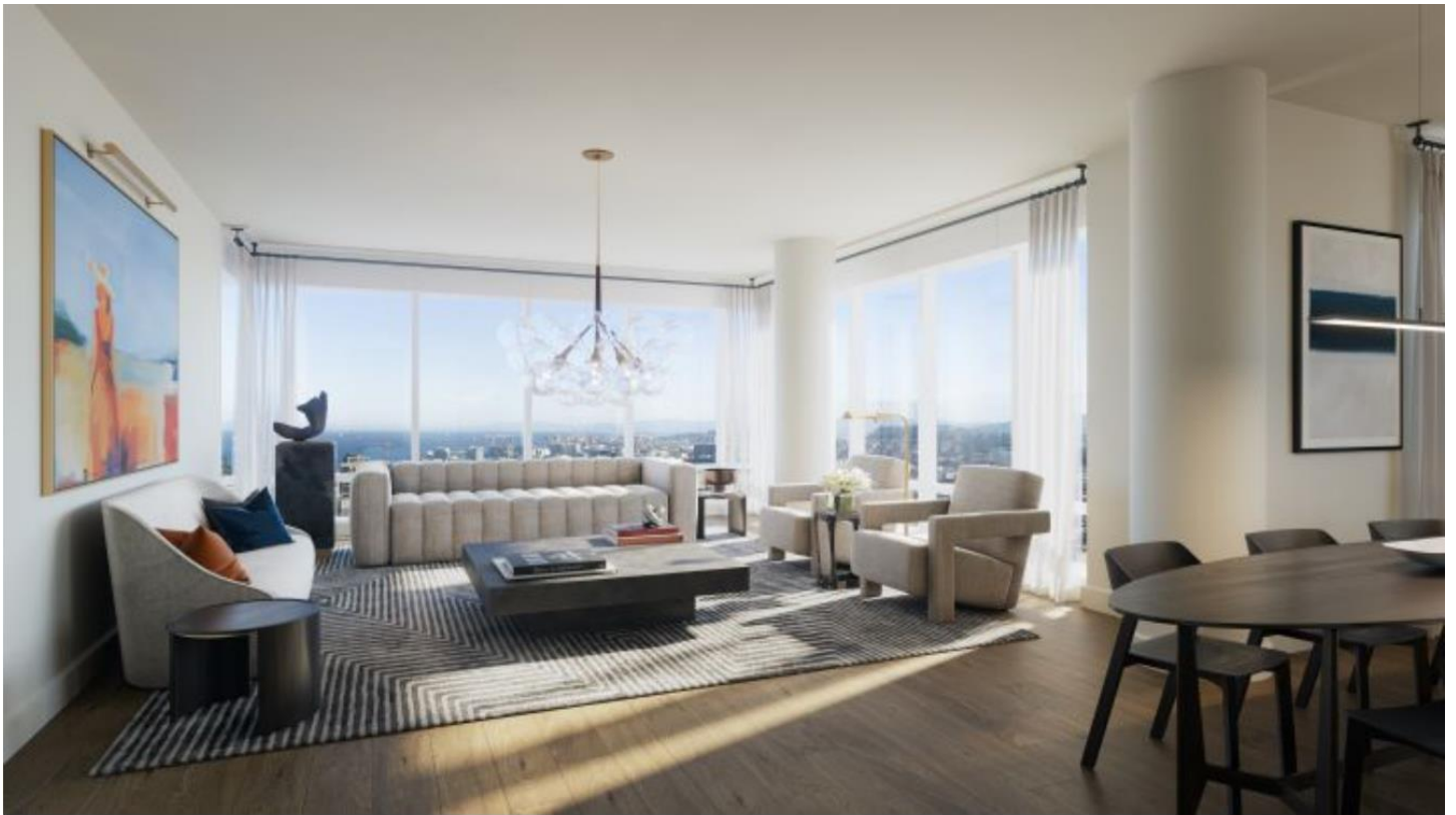
室內空間可依據屋主的需求進行不同形式的量身設計。