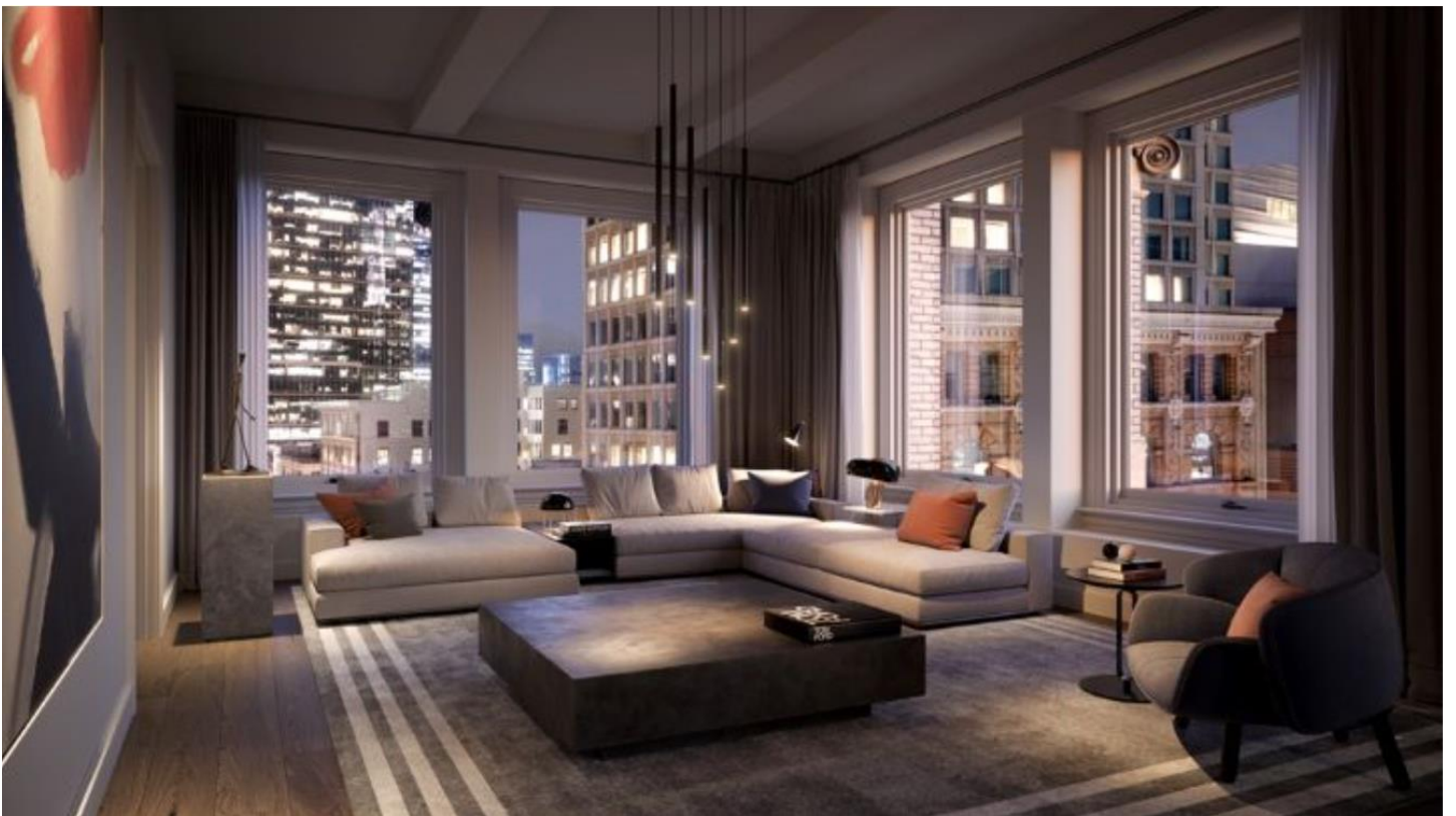
夜幕低垂的時刻，享受都會生活的時髦感。