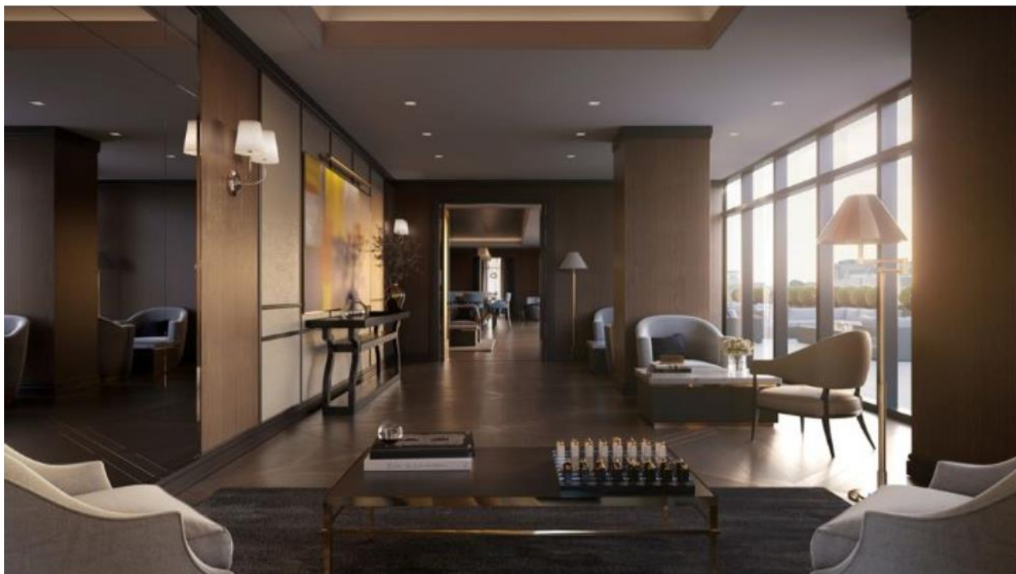
位於5樓的公共空間，為屋主提供私人俱樂部的尊榮體驗。

另一棟45層樓的全新塔樓建築，以當地的石材和現代化的玻璃帷幕材質為主，總共將規劃146間、從79坪至112坪不等的奢華私宅，依據屋主的喜好可選擇規劃成開放式的寬敞格局，或者是依不同使用機能所區隔的設計情境，展現專屬於自我生活魅力的生活情境。